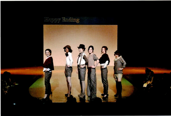
【家政学科ファッション専攻卒業制作ファッションショー】