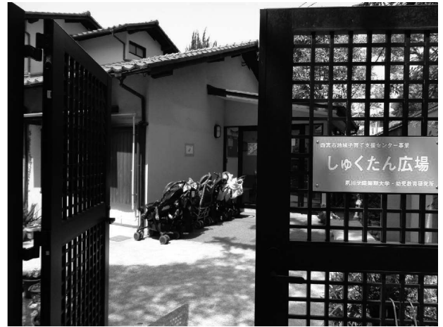
家政館に移転した「広場」