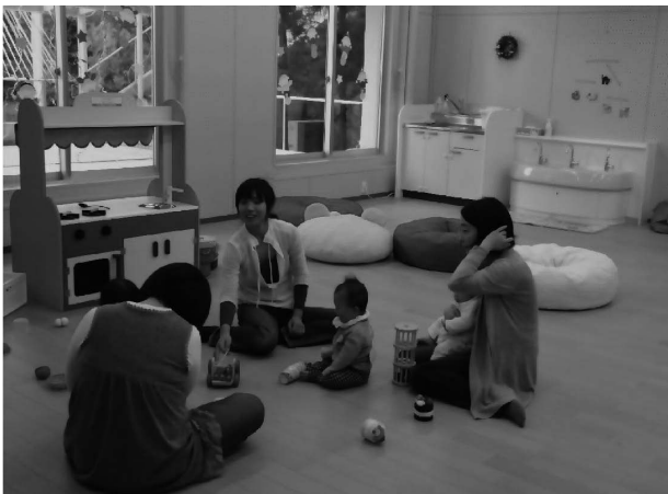
開室当時の「しゅくたん広場」の様子

いなくても良い感じがする」「私のことが好きではないかもしれない」といった話を繰り返しておられた。しかし、子どもはちゃんと遊びの途中で母親を確認しており、子どもの方から母親にくっついていく様子も見受けられた。母親が何か子どもの気持ちをしっかりと受け止めかねている感じが感じられたため、子どもは遊びながらお母さんをちゃんと見て、確認できると安心して遊んでいることを伝えた。また、その場で母親の背中にもたれかかって嬉しそうにしている子どものそのタイミングを捉え、「お母さんとくっついた一で嬉しいなあ」と筆者が言うと子どもは笑いながら何度も母親にくっついたを繰り返し、母親も「くっついた一、くっついた一」と子どもが母親を求めて安心し、喜んでいるという実感を持ちながら子どもと関わっている様子が捉えられた。母親の悩みを母子の実際のやりとりの中で、取り上げ理解を促すことでその後の母子のかかわりを変容させていくことが可能となる。これは、親子で利用する子育て支援広場であるからこそできる相談の事例である。