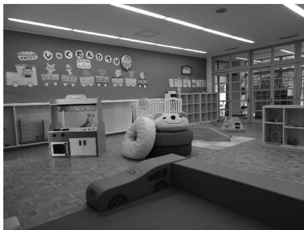
付属幼稚園内に移転した「広場」

2016年度の不定期講座は保育アドバイザーによる季節の行事を取り入れたものや、パパ講座とおじいちゃん、おばあちゃん DAY の開催(年6回)、ママ企画講座ではアロマを取り上げたもの等が年3回行われた。