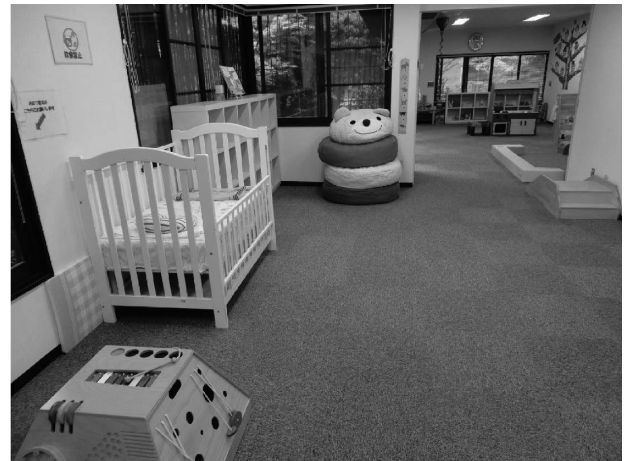
家政館の「広場」の部屋