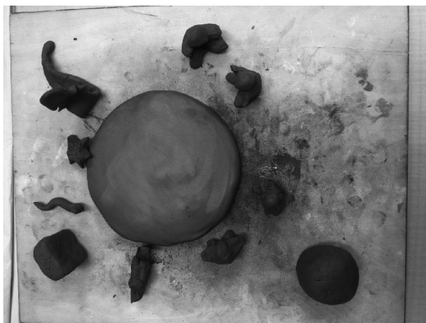
心理学シリーズ②：粘土遊びの作品例

参加者は自分自身の感情や考えにより深く向き合いながら、メンバーとの交流を経験していく。そこでは、ひとりひとりが様々な思いを抱えて参加しており、どのような“私”であれ、そこに集まったグループのメンバーから受け止めてもらえるという安心感を感じられる。その経験がそれぞれの子育てと親の育ちを支えることに繋がると考えている。このような他者とのつながりと自身の心の深まりをしっかりと統合できる場の提供を今後も検討していきたい。