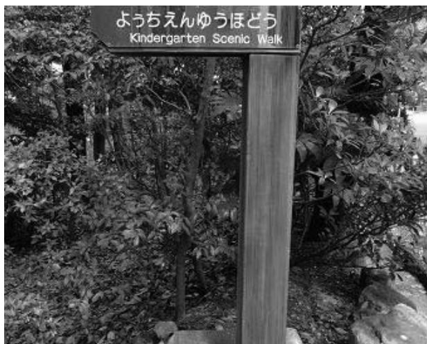
付属幼稚園の森の小道を下ると「広場」がある