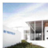
神戸夙川学院大学