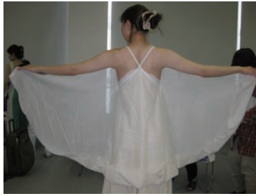
ディテール：フロント部分 ディテール：スカート部分 ディテール：サイド全身